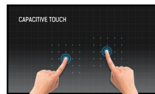
Touch Technologie - Kapazitiv

Die IPS-Displays sind vor allem für weite Betrachtungswinkel und natürliche, hochgenaue Farben bekannt. Sie eignen sich besonders für farbkritische Anwendungen.