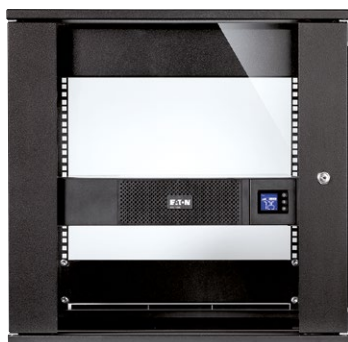
Geringe Tiefe für einfache Integration in kleinen Gehäusen