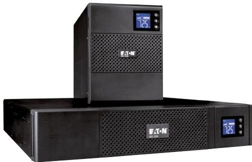
Die 5SC ist in praktischen kompakten Formfaktoren verfügbar