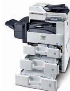
Abbildung mit Optionen.

KYOCERA MITA DEUTSCHLAND GmbH – Otto-Hahn-Str.12 – D-40670 Meerbusch Infoline: 0800 867 78 76 – Fax: +49(0)21 59 9 18-106 – www.kyoceramita.de