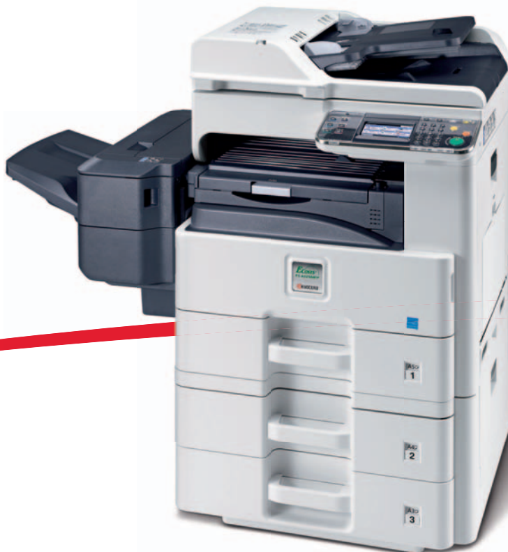
Abbildung mit Optionen.

25 JAHRE Wirtschaftlicher drucken und kopieren.