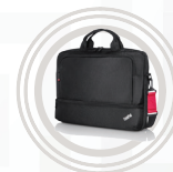
ThinkPad Essential Topload Tasche