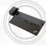
ThinkPad Ultra Dock