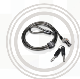
Microsaver DS Kabelverriegelung