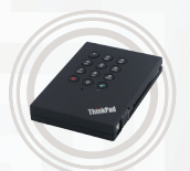
ThinkPad USB 3.0 Sicherheitsfestplattenlaufwerk