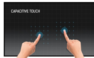
Touch technologie - Kapazitiv

Die IPS Panel Technologie bietet einen hohen Kontrast und gute Farbbrillanz, bei einem viel größeren Einblickwinkel als bei der standard TN-Panel Technologie.