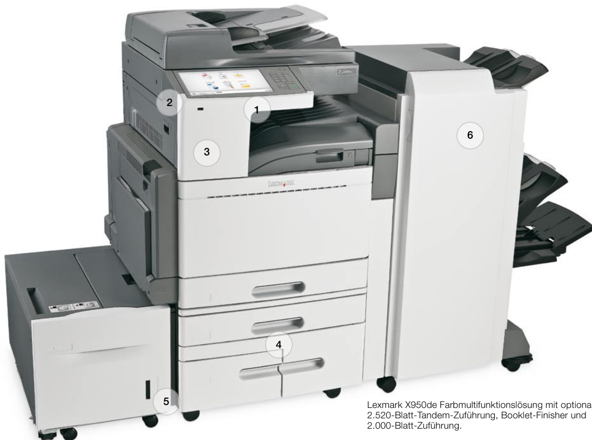
Lexmark X950de Farbmultifunktionslösung mit optionaler 2.520-Blatt-Tandem-Zuführung, Booklet-Finisher und 2.000-Blatt-Zuführung.