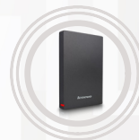
Portable Lenovo 1 TB UHD F309- Sicherheitsfestplatte