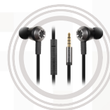
Lenovo 500 Extra Bass In- Ohr-Kopfhörer