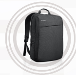
Lenovo Freizeitricksack B200