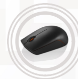
Kompakte Lenovo 300 Wireless-Maus