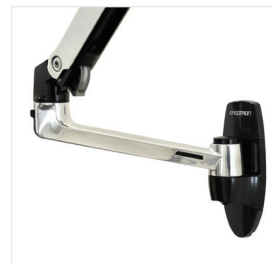
LX-VERLÄNGERUNG ERHÖHT DIE REICHWEITE UM 23 CM. POLIERTES ALUMINIUM (45-289-026) MATTSCHWARZ (45-289-224)