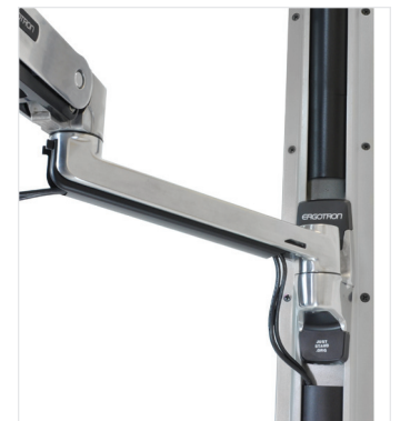
EMPFOHLEN: BEFESTIGEN SIE DEN MONITOR ARM MIT DER HALTERUNG (97-091) AN EINER ERGOTRON-WANDSCHIENE.