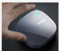
Kompaktes Format zum einfachen Mitnehmen und Ausdrucken