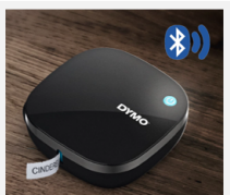
Automatische Bluetooth-Verbindung, bereit zum Erstellen und Drucken Ihrer Etiketten!