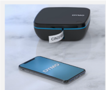
Einfaches Erstellen von Etiketten auf dem Smartphone oder Tablet mit der neuen, intuitiven DYMO®-App!