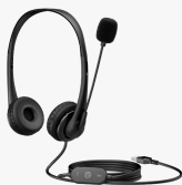
HP Stereo-USB-Headset G2 428H5AA