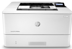
HP LaserJet Pro M404dw

Geschäftlich erfolgreich zu sein bedeutet, smarter zu arbeiten. Der HP LaserJet Pro M404 Drucker ist so konzipiert, dass Sie Ihre Zeit dort nutzen können, wo sie am effektivsten ist – und so zum Wachstum Ihres Unternehmens beitragen und gleichzeitig der Konkurrenz einen Schritt voraus sind.