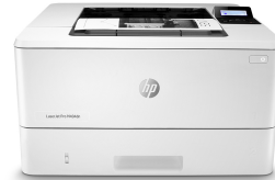
HP LaserJet Pro M404dn

Dieser Drucker ist nur für die Verwendung mit Druckpatronen vorgesehen, die über einen neuen oder wiederverwendeten HP-Chip verfügen. Er nutzt dynamische Sicherheitsmaßnahmen, um Druckpatronen zu blockieren, die einen nicht von HP stammenden Chip aufweisen. Regelmäßige Firmware-Updates erhalten die Wirksamkeit dieser Maßnahmen aufrecht und blockieren Druckpatronen, die zuvor funktioniert haben. Ein wiederverwendeter HP-Chip ermöglicht die Verwendung von wiederverwendeten, wiederaufbereiteten und wiederbefüllten Druckpatronen. Mehr dazu unter: http://www.hp.com/learn/ds