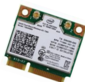
Intel WLAN Kit 802.11ac + Bluetooth