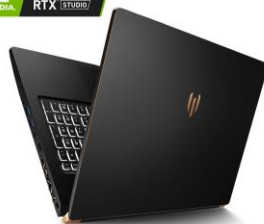
NVIDIA® QUADRO RTX™ STUDIO HIGH-END-GRAFIK