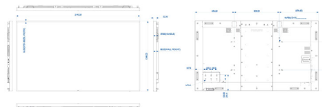
Philips 98BDL4150D Technische Zeichnung