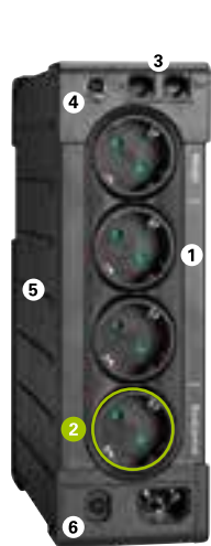
Eaton Ellipse PRO 650