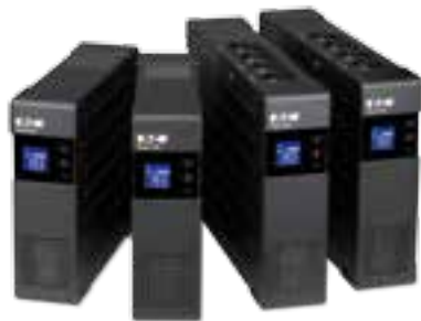
Ellipse PRO Baureihe