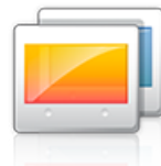
Anpassung des Displays