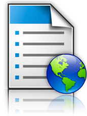
Formulare und Favoriten

Anpassung des Displays: Zeigen Sie eine individuell angepasste Diashow auf dem Farb-Touchscreen an, um den Anwendern wichtige Informationen mitzuteilen, während sich das Gerät im Stromsparmmodus befindet.