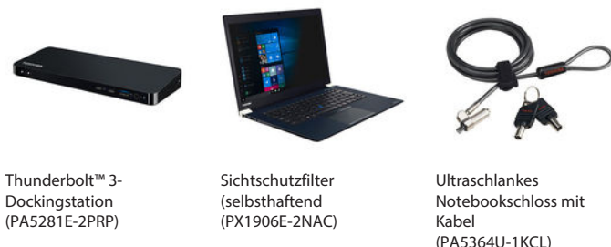
Thunderbolt™ 3-Dockingstation (PA5281E-2PRP)