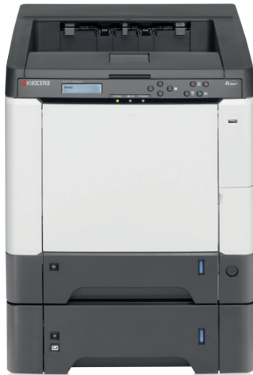
Abb. mit Option