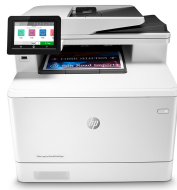
HP Color LaserJet Pro M479dw

Geschäftlich erfolgreich zu sein bedeutet, smarter zu arbeiten. Der HP Color LaserJet Pro MFP M479 ist so konzipiert, dass Sie Ihre Zeit auf eine effektive Unterstützung des Unternehmenswachstums konzentrieren können und gleichzeitig der Konkurrenz einen Schritt voraus sind.