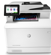
HP Color LaserJet Pro M479fwn

Dieser Drucker ist nur für die Verwendung mit Druckpatronen vorgesehen, die über einen neuen oder wiederverwendeten HP-Chip verfügen. Er nutzt dynamische Sicherheitsmaßnahmen, um Druckpatronen zu blockieren, die einen nicht von HP stammenden Chip aufweisen. Regelmäßige Firmware-Updates erhalten die Wirksamkeit dieser Maßnahmen aufrecht und blockieren Druckpatronen, die zuvor funktioniert haben. Ein wiederverwendeter HP-Chip ermöglicht die Verwendung von wiederverwendeten, wiederaufbereiteten und wiederbefüllten Druckpatronen. Mehr dazu unter: http://www.hp.com/learn/ds