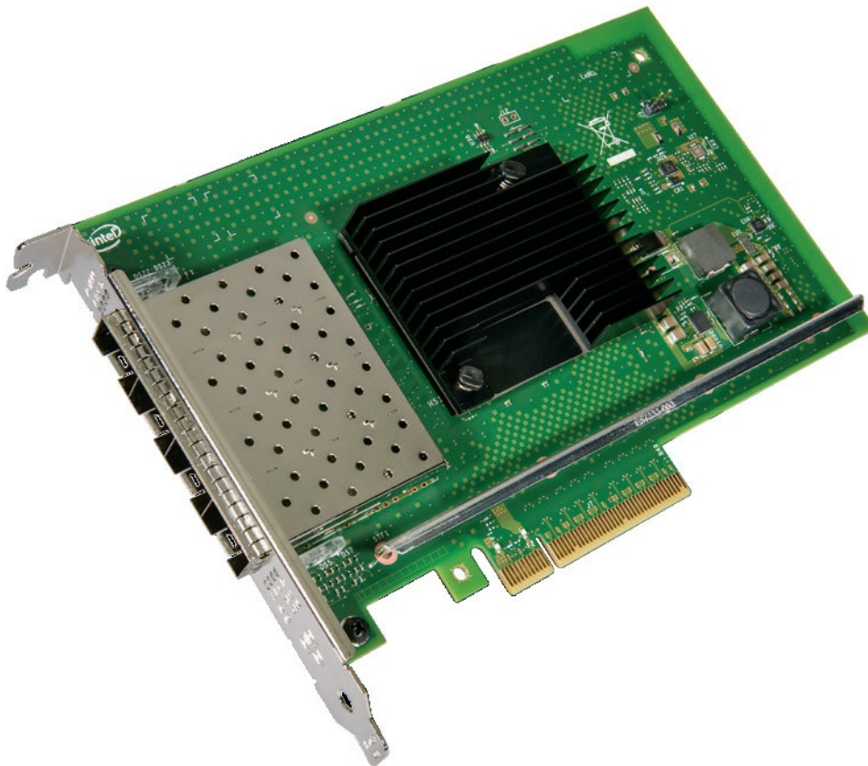
Figure 3. Intel X710-DA4 4x10Gb SFP+ Adapter

The following figure shows the Intel X710-DA4 4x10Gb SFP+ Adapter (full-height half-length form factor).