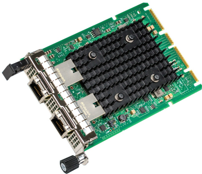
Figure 2. ThinkSystem Intel X710-T2L 10GBASE-T 2-port OCP Ethernet Adapter