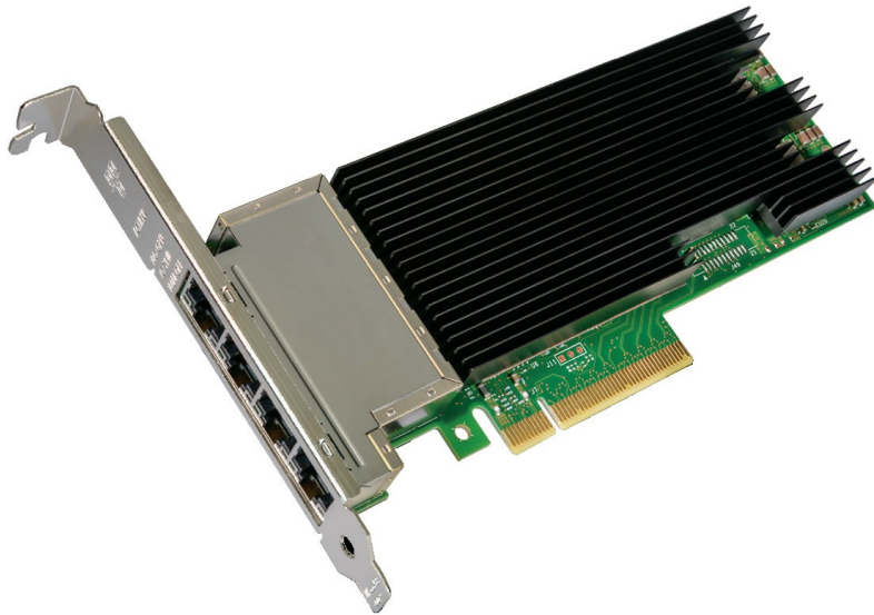
Figure 4. Intel X710-T4 4x10Gb Base-T Adapter

The following figure shows the Intel X710-T4 4x10Gb Base-T Adapter.