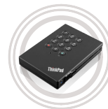
ThinkPad® USB 3.0 externe Sicherheitsfestplatte