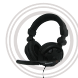
Lenovo™ P950 Headset