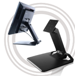
Universaler Lenovo™ All-in-One-Standfuß