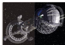
Without SmartImage GAME With SmartImage GAME

Das neue Philips Gaming Display verfügt über eine OSD-Steuerung mit Schnellzugriff (speziell auf Spieler abgestimmt) und bietet Ihnen mehrere Optionen. Der "FPS"-Modus (First Person Shooting) verbessert dunkle Bereiche in Spielen und ermöglicht Ihnen, versteckte Objekte in solchen Bereichen zu sehen. Der "Racing"-Modus stellt das Display auf die schnellste Reaktionszeit und hohe Farbwiedergabe ein, und nimmt zusätzlich