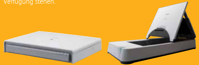
DIN A3-Flachbett-Scaneinheit 201 DIN A4-Flachbett-Scaneinheit 101

Scannen Sie Bücher, Zeitschriften und empfindliche Materialien mit der optionalen Flachbett-Scaneinheit 101 für Formate bis DIN A4 oder der Flachbett-Scaneinheit 201 für Formate bis DIN A3. Diese Flachbett-Scaneinheiten werden per USB verbunden und arbeiten problemlos mit dem DR-6010C zusammen, sodass für jeden Scanvorgang die gleichen Bildoptimierungsfunktionen zur Verfügung stehen.