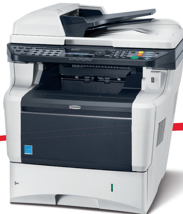
Abbildung zeigt FS-3140MFP+

25 JAHRE Wirtschaftlicher drucken und kopieren.