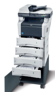
Abbildung mit Optionen.