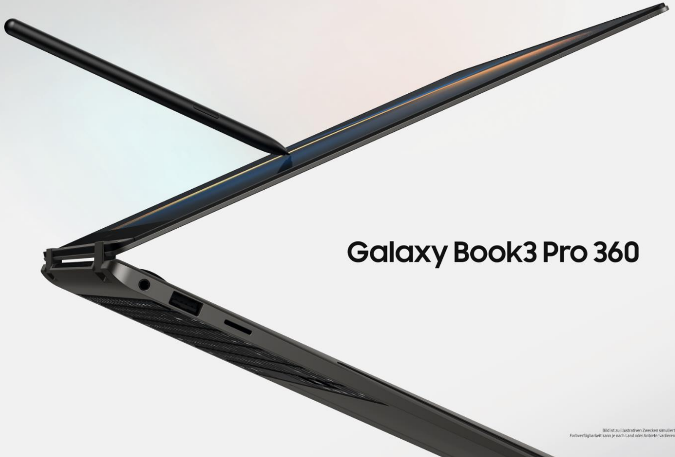
Bild ist zu illustrativen Zwecken simuliert. Farbverfügbarkeit kann je nach Land oder Anbieter variieren.