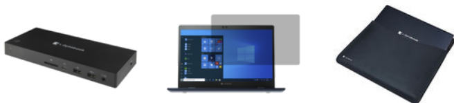
dynabook USB-C™-Dockingstation (PA5356E-1PRP)