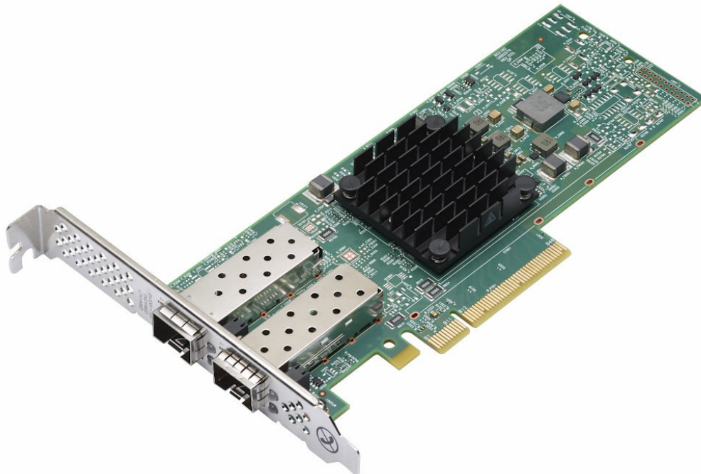
Figure 1. ThinkSystem Broadcom 57414 10/25GbE SFP28 2-port PCIe Ethernet Adapter

The following figure shows the 2-port adapter.