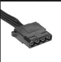
2x 4-pol. IDE-Stromanschlüsse