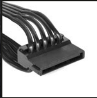
4x SATA- Stromanschlüsse