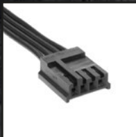
1x Floppy- Stromanschluss