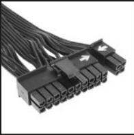
1x 20+4-pol. Mainboard-Anschluss