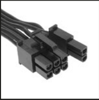
2x 6+2-pol. PCIe-Anschluss