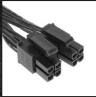
1x 4+4-pol. CPU-Stromanschluss