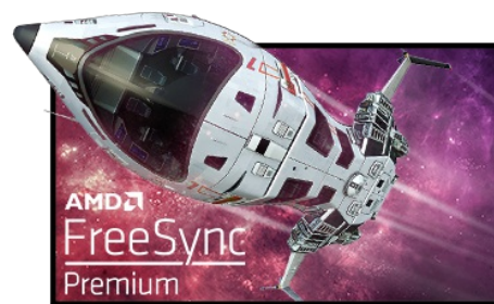
FreeSync™ Premium Technologie

Die Fast IPS Technologie garantiert nicht nur lebendige Schlachtfeldszenen mit hoher Farbtreue, sondern auch eine ultraschnelle Reaktionszeit von nur 0.8ms (MPRT) für bewegte Bilder.