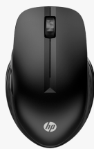
HP 430 Wireless-Maus für mehrere Geräte 3B4Q2AA