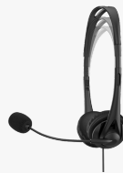
HP Stereo-Headset (3,5 mm) G2 428H6AA