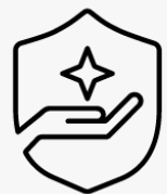
3 Jahre Abhol- und Lieferservice U4812E