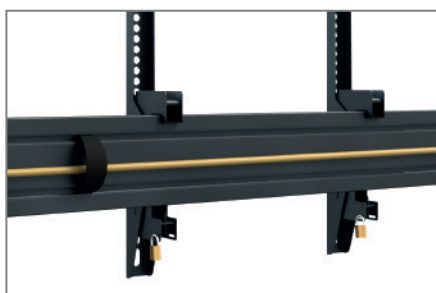
Kabelmanagement mittels Kabelclips