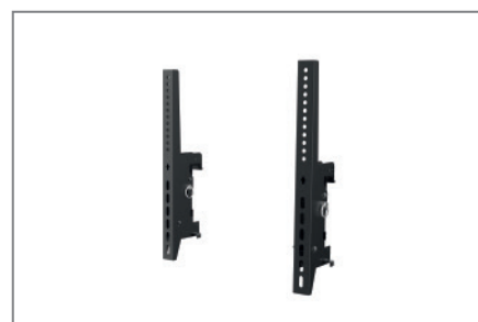
VESA max. 600 x 400 mm