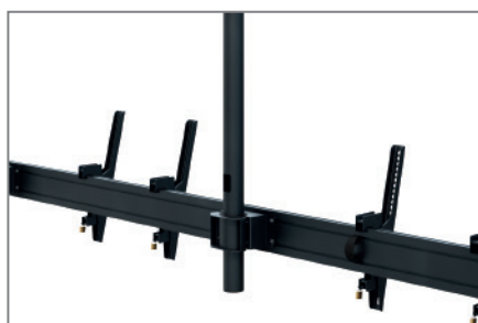
Anpassbar dank modularer Bauweise