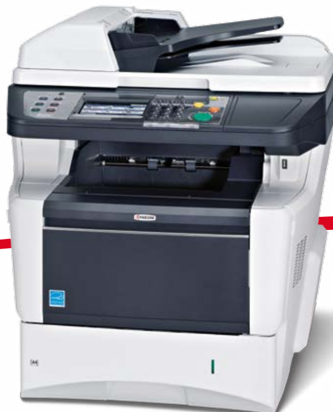
Abbildung zeigt FS-3640MFP

25 JAHRE Wirtschaftlicher drucken und kopieren.