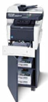
Abbildung mit Optionen.