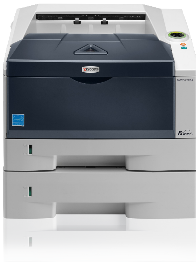
Abb. mit Optionen