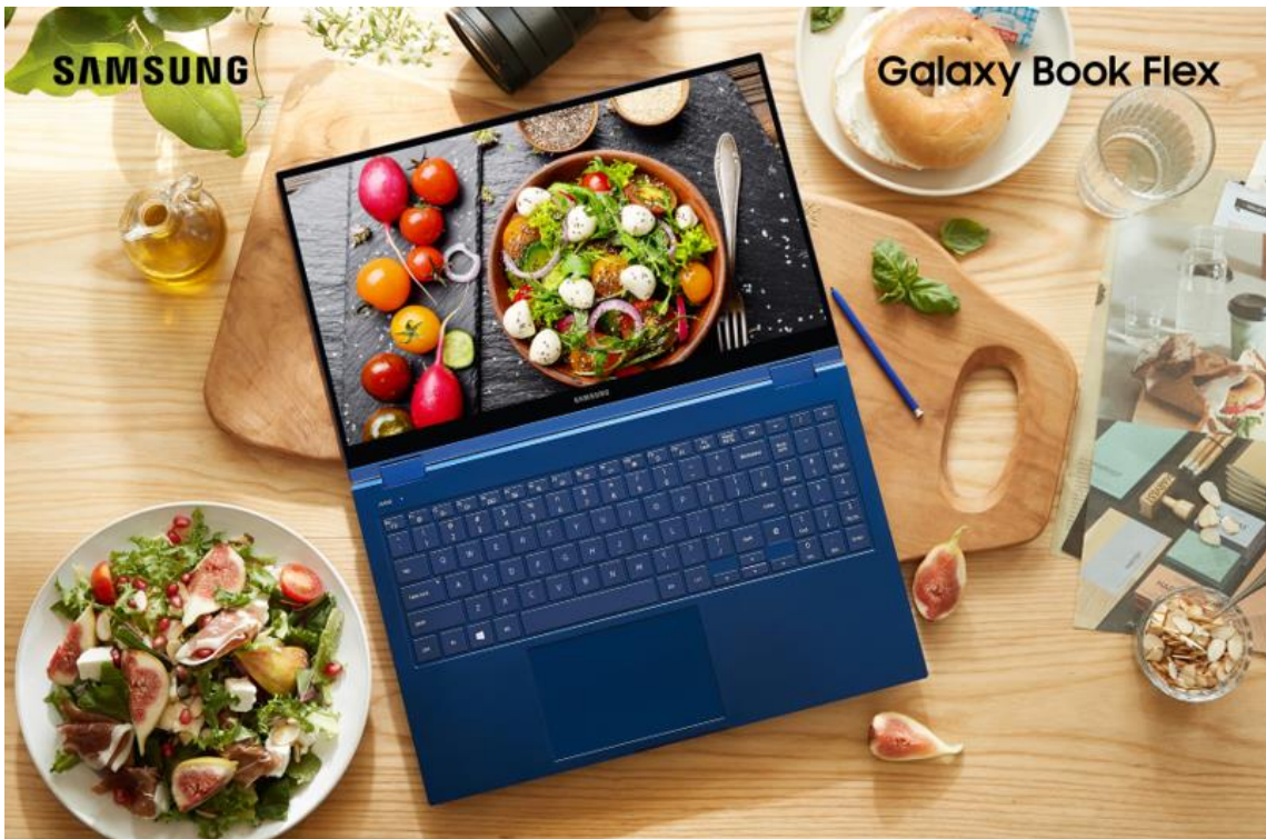
Abbildung Galaxy Book Flex – 15 Zoll

Das Galaxy Book Flex ist ein Multitalent, das sich unterschiedlichen Situationen anpassen kann. Es besticht durch seine schlanken Maße in einem eleganten Metall-Design. Das Scharnier auf der Rückseite und der Faltmechanismus machen es vielseitig und verleihen ihm Flexibilität. Dadurch bietet es dir Aufstellmöglichkeiten für fast jeden Ort und Einsatzzweck. Darüber hinaus begeistert der multifunktionale S Pen, welcher im Gerät aufbewahrt werden kann. Dank der Air Action-Funktion kannst du mit Hilfe von Gesten durch Präsentationen führen, Medien abspielen oder die Lautstärke verändern. Während du mit dem Samsung Galaxy Book Flex arbeitest, über Samsung DeX Daten zwischen deinem Smartphone und dem Notebook austauschst oder über die integrierten Lautsprecher den mitreißenden Klang Sound by AKG genießt, kannst du auf dem Touchpad kabellos andere kompatible Geräte laden. Haben wir dir zu viel versprochen?