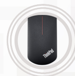
ThinkPad Precision kabellose Maus